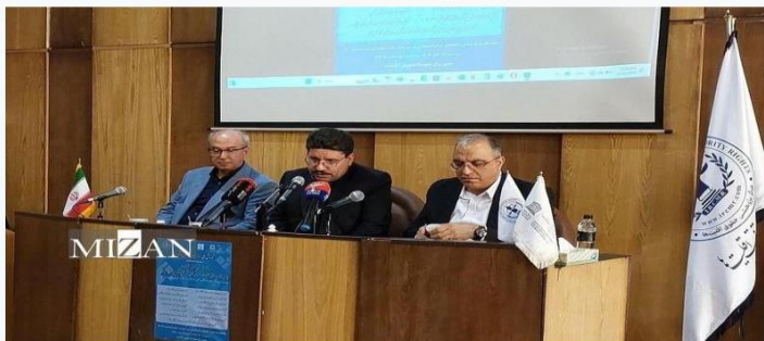
آیین رسمی افتتاحیه مرکز پژوهشی حقوق اقلیتها با حضور جمعی از استادان دانشگاهها، اندیشمندان حقوقی، نمایندگان از اقلیتها و اقوام، پژوهشگران و دانشجویان برگزار شد.

۱۳۰۴ - آذر ۲۰ ۱۴۰۳ کد خبر: FA08APP دسته بندی: حقوق بشر، عمومی